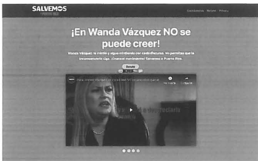
Captura de la página de Salvemos a Puerto Rico

E l Departamento de Estado de Puerto Rico determinó que las corporaciones sin fines de lucro Fundación Pro Igualdad, Inc. y Foundation For Progress, Inc., que donaron $250,000 al Súper Pac Salvemos a Puerto Rico ( http://www.salvemospr.com/ ), que hace campaña en contra de la gobernadora y candidata primarista Wanda Vázquez, fueron inscritas sin cumplir con los requisitos de la Ley General de Corporaciones por lo que son nulas, confirmaron tres fuentes al Centro de Periodismo Investigativo (CPI). Ambas corporaciones aparecen como canceladas desde este martes a las 7:49 de la noche, según el Registro de Corporaciones en línea de esa agencia.